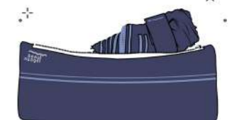
Permettant de le ranger toujours au sec !