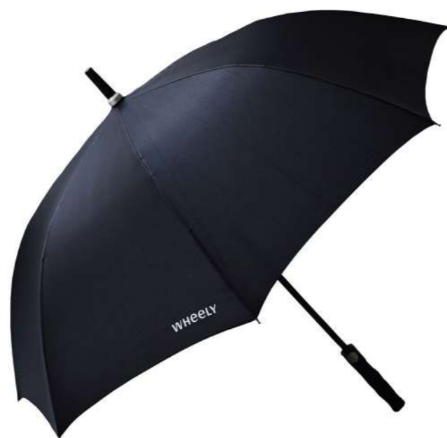
Grand parapluie personnalisé, poignée rubber, 109cm d'amplitude.

Wheely est l'un des leaders européens du VTC et sa stratégie est axée sur la garantie d'un service de prestige. Nos parapluies sont disponibles dans toutes les voitures du groupe.