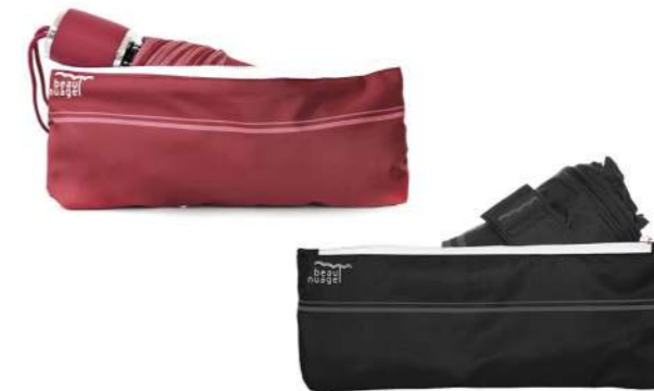
Modèle L'Original, rouge ou noir, avec housse absorbante. Outre l'innovation liée à la housse absorbante, l'Original a une poignée à mémoire de forme qui s'adapte à la forme de votre main. 90cm d'amplitude.

Tous les ans, nous fournissons également nos parapluies pliables accompagnés de housses absorbantes à de nombreux employés de la Société Générale.