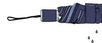
Un parapluie éco-responsable