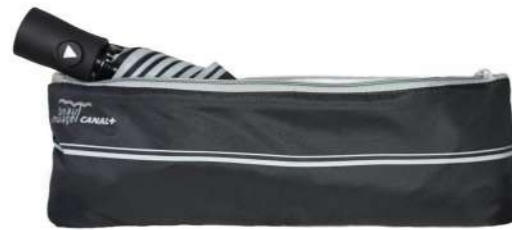
Parapluie pliable automatique personnalisé, avec housse absorbante. 98cm d'amplitude.

Beau Nuage est le fournisseur officiel de parapluies pour Canal+. Ces parapluies sont donnés aux employés du groupe, vendus dans les boutiques officielles, ou mis à disposition lors de festivals tel que le Festival de Cannes.