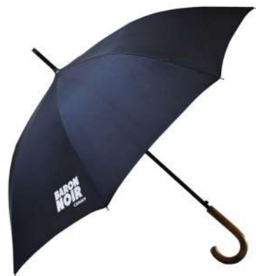
Grand parapluie personnalisé, poignée bois, 107cm d'amplitude.

Nous participons par ailleurs à la promotion de séries et de films produits par Canal+. Pour la sortie de la nouvelle saison de la série Baron Noir , nous avons ainsi conçu un parapluie canne dont les matériaux principaux sont en bois et en fibre de verre.